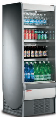
Versione H185 con fiancate cieche Version H185 with plain end panel